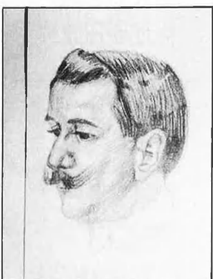
D'esquerra a dreta: Coberta de l'àlbum de dibuixos, 1918, i retrat del seu pare, 1921 (?). (Quaderns de Puebla.)