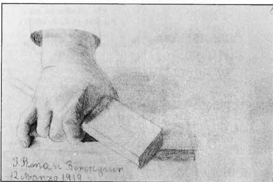
D'esquerra a dreta: Dàlia, 1918-21, i Mans, 1919. (Quaderns de Puebla.)