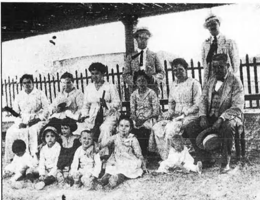
La família de Josep Renau a la platja del Cabanyal, València, 1910 (?).