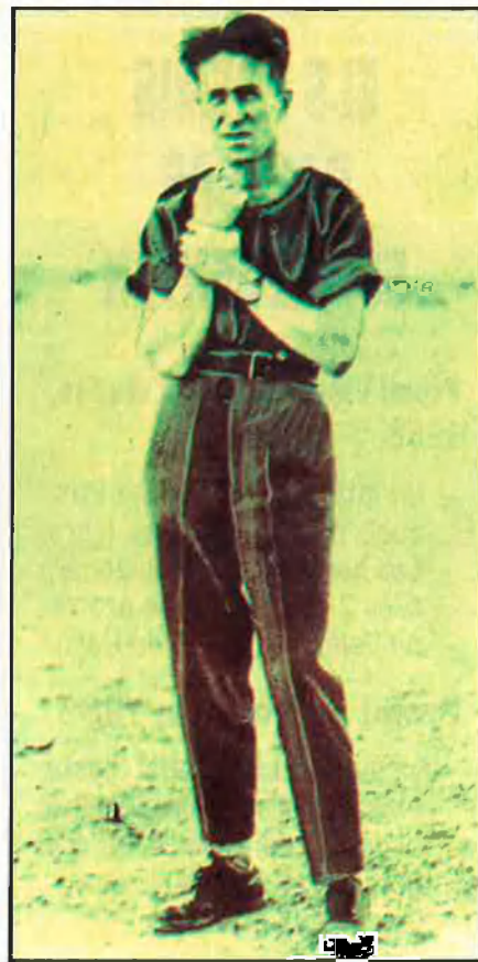
T. E. Lawrence. A l'esquerra, amb el rei Faisal.

Seria amb la gran guerra que T. E. Lawrence donaria els primers passos en una lluita que l'ocupà durant gran part de la seua vida, la guerra contra els turcs; Lawrence, que tenia la confiança de Faisal, es va ocupar de la reorganització d'un exèrcit àrab que feia temps que anava desballestat. Guerrer