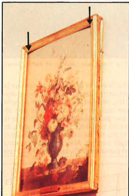
A l'esquerra, la taula del «Sant Bru» de Ribalta s'ha abonyegat per diversos llocs. A la dreta, «Gerrò de flors», de Benet Espinós, on s'aprecien també els efectes de la insuportable calor que regnava en l'exposició.