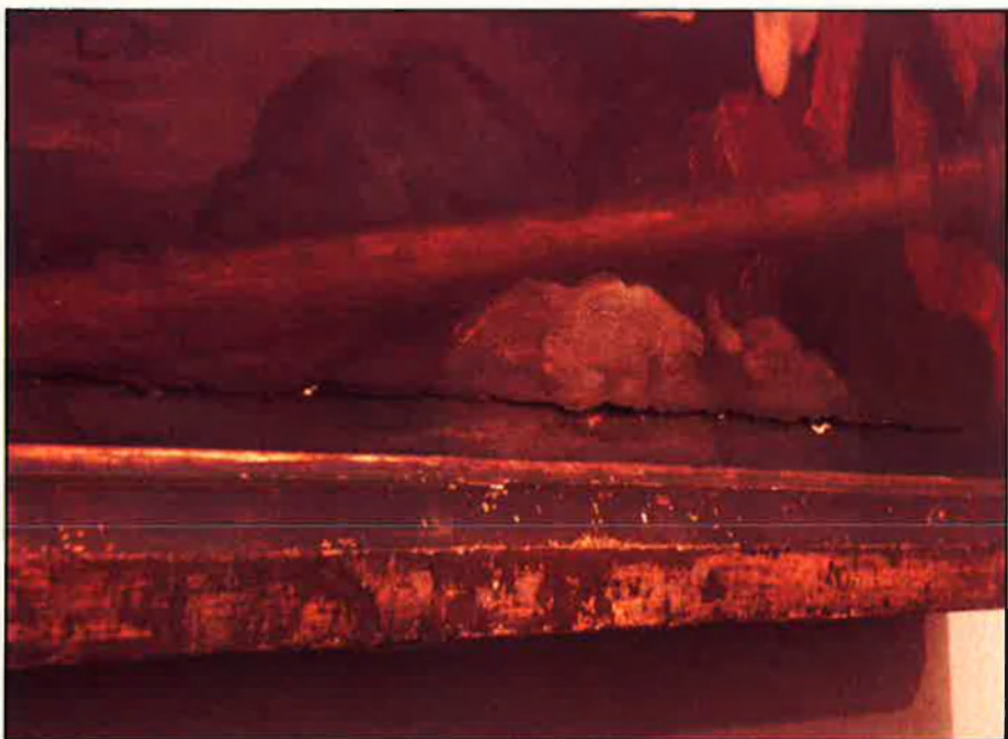
Els efectes de l'abonyegament en el quadre de Ribalta han estat desastrosos. La taula s'ha esquarterat totalment.