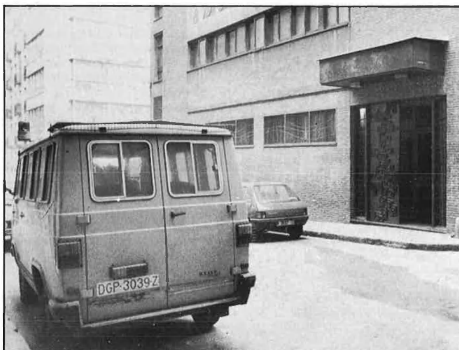
Sinagoga de Madrid.