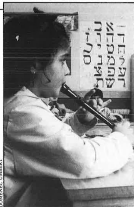
Col·legi sefardita, a Barcelona.