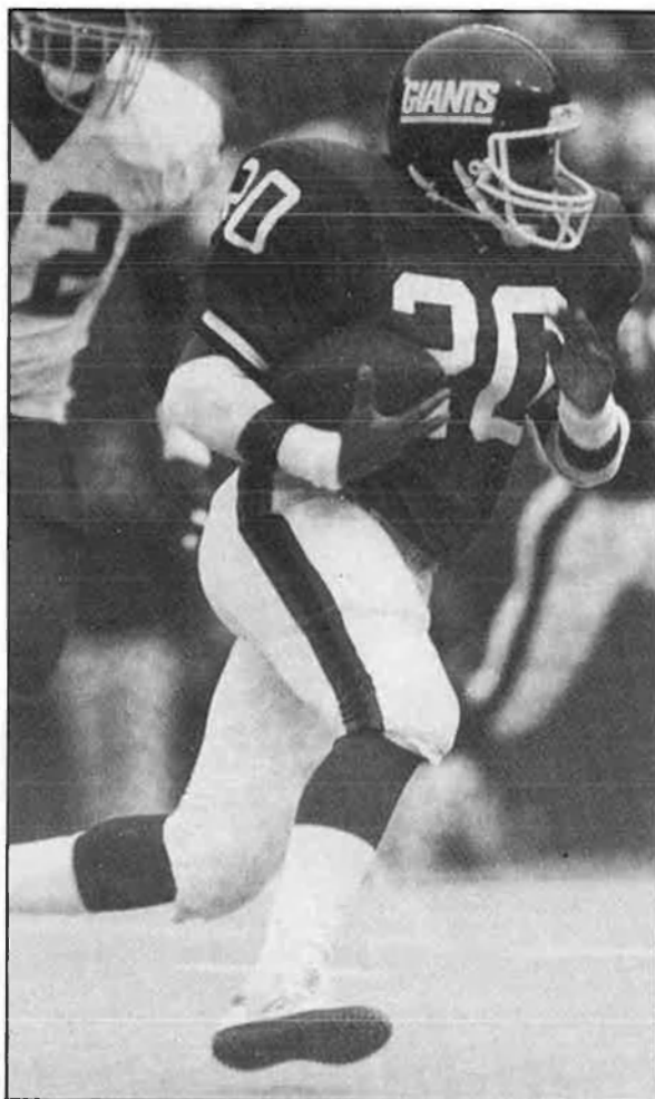
En el futbol americà, darrere de cada jugada hi ha un centenar d'hores d'entrenament.

dors del seu equip. El joc comença a desenvolupar-se en el lloc on el jugador ha estat placat i aquest té quatre downs o intents per aconseguir en jugades de carrera o de passe 10 iardes. Si en el quart intent l'equip que ataca ha de progressar moltes iardes per aconseguir una nova tanda de quatre intents, pot elegir entre fer un xut lliure o bé, si està prop de la porteria contrària, intentar un field goal (gol de camp) que si passa entre els dos pals són tres punts.