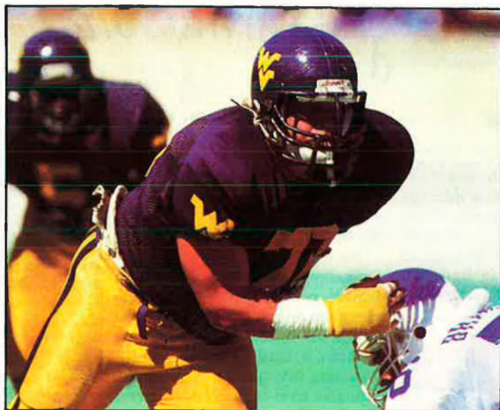
TV3 RETRANSMETRÀ EL PRÒXIM DIA 22 LA FINAL DE LA SUPERBOWL