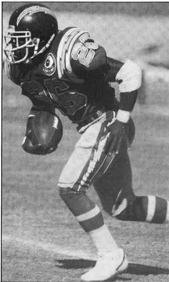
El futbol americà és, potser un dels espectacles més impressionants que exporten els EUA.

El grau de participació dels propietaris dels equips està en funció de l'equip, però la majoria de tots ells tenen un president, vice-president o manager general. Hi ha determinats clubs on l'entrenador en cap fa les funcions de manager general, però la norma de funcionament més habitual