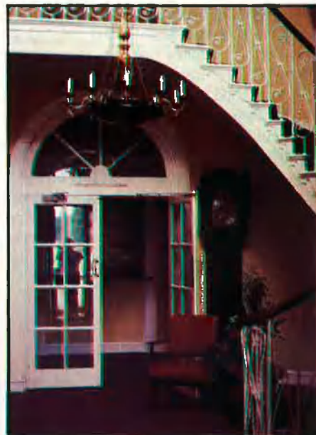
A l'esquerra, part posterior de l'edifici, reformada en diverses ocasions després de la mort dels comtes de Morella. A la dreta, entrada a la residència de Wentworth, una de les poques parts de la casa que no ha estat reformada