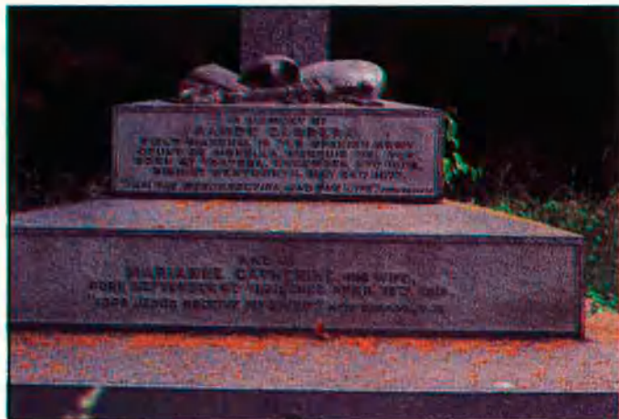
Estat actual de la tomba de Cabrera i la seva dona. Inscripció a la tomba dels comtes de Morella.