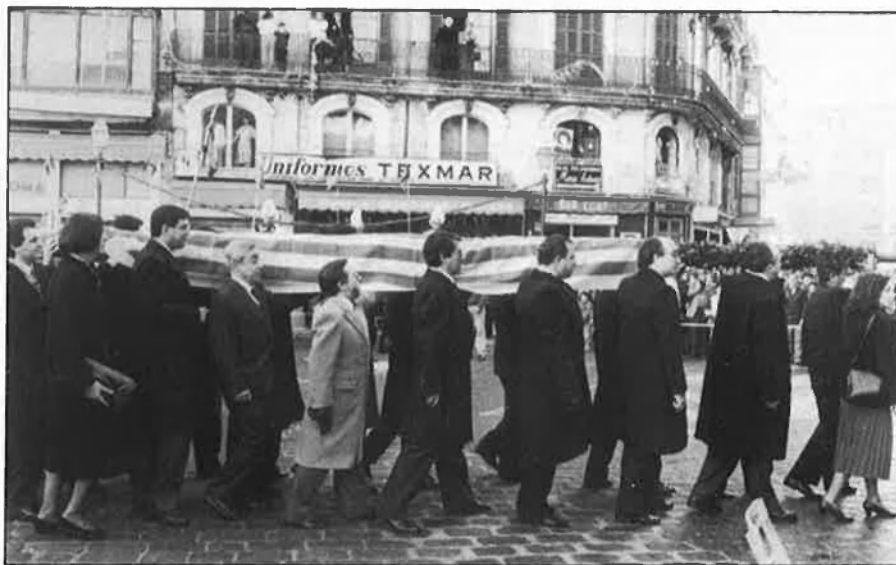
Celebració de la diada del 31 de desembre a Mallorca.

La commemoració del 31 de desembre, data tan significativa per als mallorquins, passa, això no obstant, any rere any sense pena ni glòria. El paper de l'Ajuntament evitant un compromís més gran no fa altra cosa que accentuar-ne l'oblit.