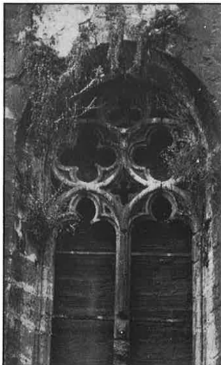
La degradació és evident en els detalls de la façana de la església de Sant Joan del Mercat de València.

La Diputació de València, per la seua banda, començarà enguany les obres de consolidació del monestir dominic de Llutxent, del qual és propietària des de fa vuit anys. Actualment és ocupat pel centre de rehabilitació de toxicòmans d'El Patriarca, i es troba en un estat lamentable de conservació. Continuarà, a més, les obres del Palau de la Scala, que ja van per la sisena fase, i participarà al 50% en el projecte de Sant Miquel dels Reis. Aquest monestir, situat als afores de València, conserva, encara que molt deteriorat, un dels dos claustres que hi havia, el qual manté una gran similitud amb el claustre dels evangelistes de l'Escorial.