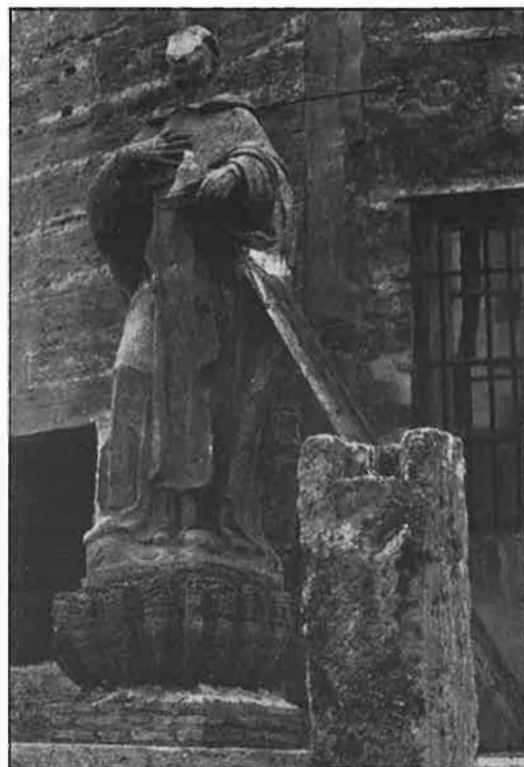
El mal de la pedra dels edificis i monuments antics encara no té antídot.

La neteja és, consegüentment, una de les primeres i més importants fases del procés de restauració actual, tal com es va fixar al congrés de Bolonya de l'any 1975. Entre els procediments utilitzats per a eliminar la brutícia de la pedra ha estat rebutjat de ple aquell vell mètode dels raspalls d'arena que grataven la superfície pètria i es prefereixen altres mètodes menys traumàtics. S'usa entre altres l'ideat per l'Institut de Restauro di Roma que consisteix a cobrir la pedra amb una pasta gelatinosa, el microbany amb òxid d'alumini, que ha servit per a netejar els portals de la catedral de Ferrara, o el de la boira d'aigua amb el qual polvoritzen amb poca pressió i durant molt de temps les parts més brutes. □