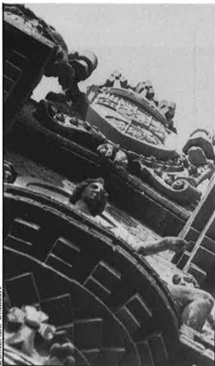
Detall de l'Arc de Triomf, a Barcelona.