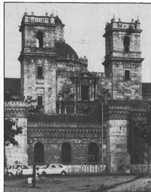
Sant Miquel del Reis, que ha estat des de col·legi públic fins a quarter, es vol ara recuperar com a monument.

En opinió de l'arquitecte Julià Esteban, cap del Servei de Patrimoni Immoble de la Conselleria de Cultura, «entrar a restaurar un monument com ara Sant Miquel dels Reis, amb un grup de 30 o 40 joves que s'han format en una escola-taller, és una barbaritat». Aquest arquitecte considera que són obres de molta envergadura amb un cert grau de dificultat i cal tenir molta cura i control del que s'hi fa. Però malgrat aquest risc, la Conselleria ha accedit també a l'oferta llançada per l'INEM i té també en funcionament alguna escola-taller.