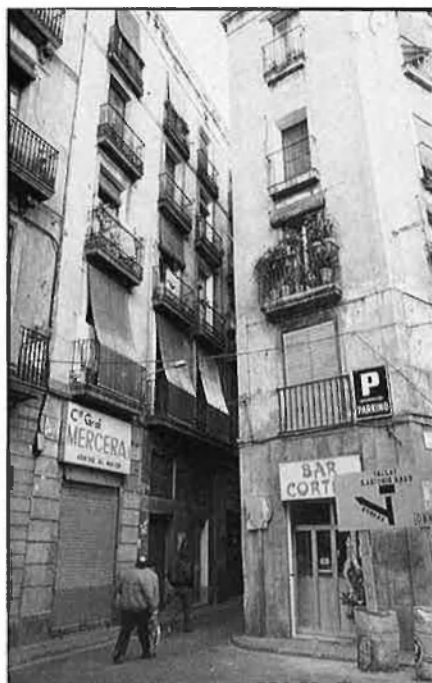
El Raval està disposat a la rehabilitació.

L'obra urbanística més important del pla especial de reforma interior del Raval és la gran plaça que s'ha d'obrir entre els carrers del Carme i Nou de la Rambla, seguint el carrer de la Cadena. El projecte és molt ambiciós perquè afecta la zona del barri més degradada, allà on el tràfic de drogues, la prostitució i la delinqüència arriben a límits insospitats. De moment, s'han tancat algunes pensions per falta d'hi-