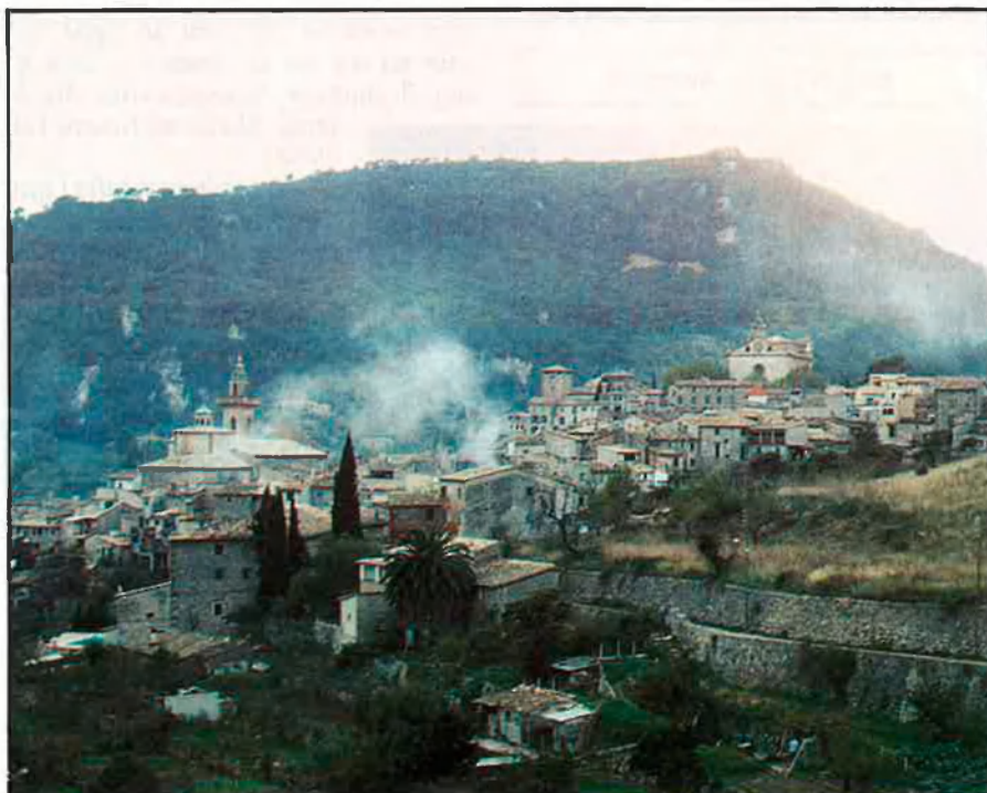
Valldemossa, cent cinquanta anys després.

Semblava aleshores que ja les velles nafres havien guarit. □