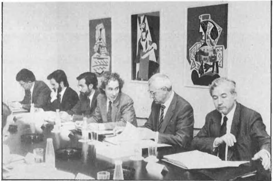
Constitució del Consell Rector de l'IVAM.