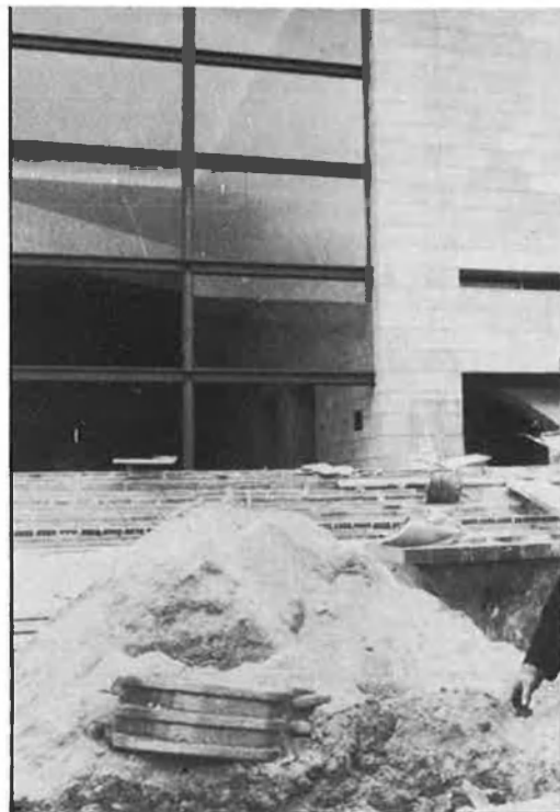
Presentació de l'IVAM als mitjans de comunicació.

Fou precisament la constitució del Consell Rector de l'IVAM un dels