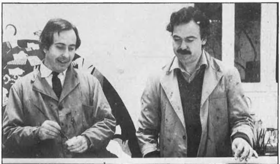
Una antològica de l'Equip Crònica inaugurarà el Centre Julio González.

l'IVAM ha estat provocat per la ubicació al Barri del Carme. Des de l'Associació de Veïns s'ha contestat el projecte, ja que segons ells no s'ha tingut en compte un objectiu global sinó que s'ha actuat d'una manera aïllada. Mentrestant, la degradació del barri continua d'una manera irreversible.