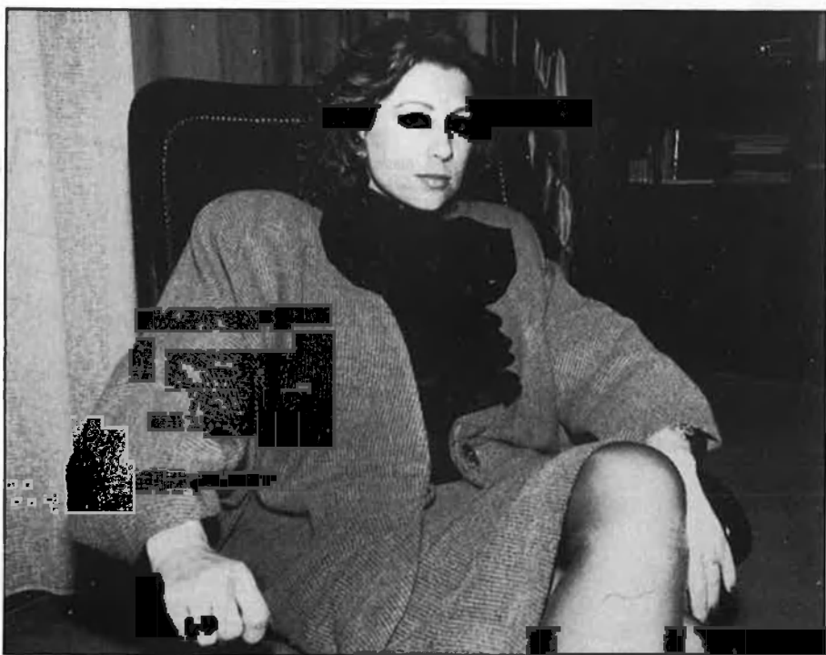
Maria Antònia Munar, consellera d'Educació i Ciència del govern balear.

En definitiva, tot són diners. I amb diners, torrons. I si penseu que esteu immunitzats contra les despeses de Nadal, ho teniu cru. Les vacunes no fan efecte. Segur que acabareu comprant algun disc de la WEA o dels recomanats per Pryca o El Corte Inglés, sense oblidar les ofertes de llibres, o les fantàstiques pel·lícules amb què bombardeja la publicitat de Nadal. La temptació, malgrat tot, està servida. □