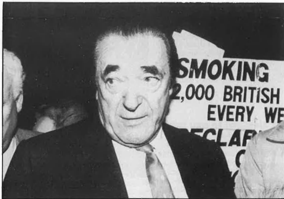
Robert Maxwell, magnat de la premsa britànica, és el pare del diari-hamburguesa «The European».

The European , doncs, ja està en la rampa de llançament. Els seus promotors preveuen regalar-lo massivament als principals aeroports europeus el 9 de maig (cosa que també va fer —casualitat— l' USA Today el seu primer dia). Caldrà esperar almenys cinc anys per a veure si esdevé un succés important com ho és ja l' USA Today , el diari matriu del periodisme-hamburguesa. En aquest cas, de la bona hamburguesa. □