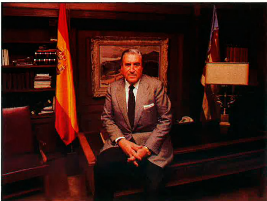
«El finançament borsari és l'alternativa al finançament bancari».

perquè la Borsa continue sent un agent de desenvolupament industrial de l'àrea econòmica en què opera?