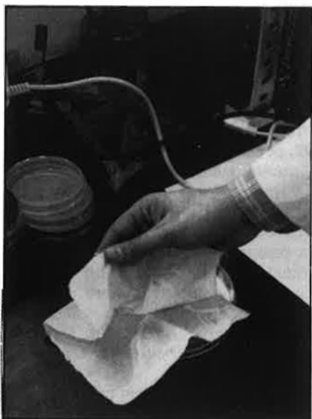
El plàstic biodegradable s'està aplicant, per ara, en medicina.

El nou plàstic biodegradable obtingut a partir de bacteries de les salines de Santa Pola es va presentar recentment en la Fira de Biotecnologia de Hannover (RFA) i va suscitar un gran interès entre els ambients científics internacionals. El projecte de la Universitat d'Alacant ha estat inclòs al Pla Estatal de Biotecnologia i ha estat finançat amb sis milions de pessetes. En un futur pròxim es pensa instal·lar una planta pilot per a produir aquest plàstic en grans quantitats. □