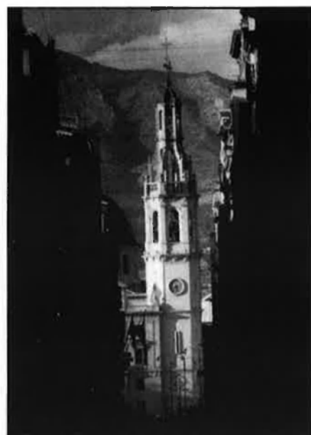
Alcoi, crispada per l'actuació policial.

Segons la versió oficial de la policia, malgrat que els agents van fer diversos trets a l'aire, l'atracador va aconseguir despistar els seus perseguidors. En aquest moment, un cotxe de la policia decideix tornar a casa de la dona