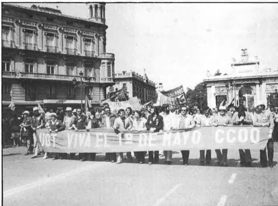
Manifestació de l'1 de maig, convocada per CCOO i UGT.

era procedent que el sindicat germà recorreguera a formacions de dreta per a tractar d'arribar a acords contra la política del govern». Però, quan CCOO i UGT decidien, conjuntament, la convocatòria de vaga general de 24 hores