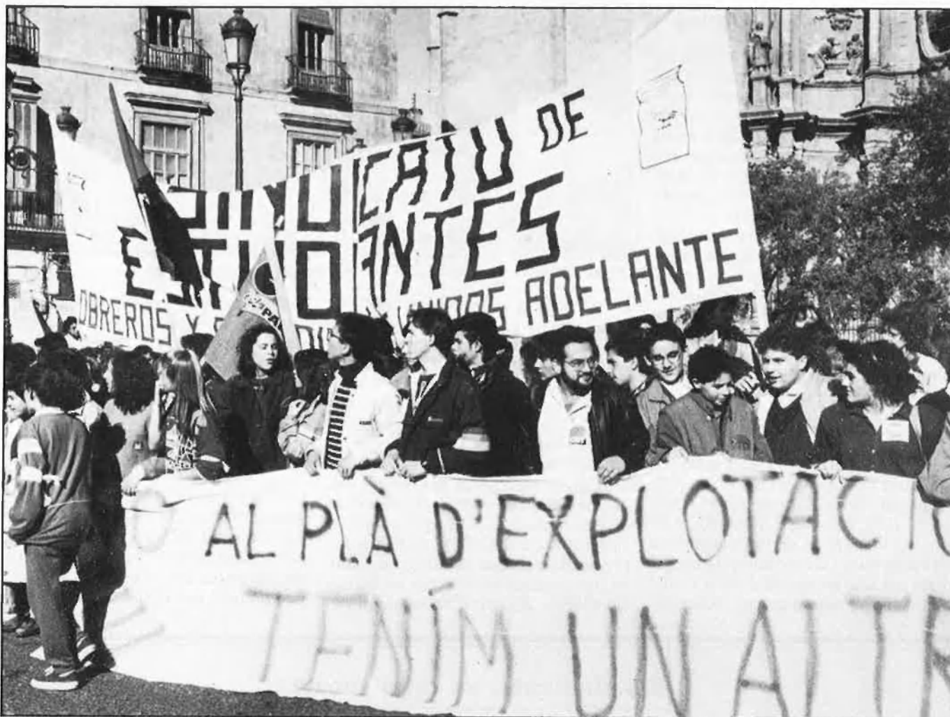
Recent manifestació d'estudiants a València contra el POJ.

Un futur encara incert és el que es preveu per a les relacions del govern-PSOE amb la fins ara central afí, UGT. La campanya prèvia a la vaga i el desenvolupament d'aquesta clamen al cel per un retorn al diàleg, altrament els socialistes es queden sense sindicat i els ugetistes sense partit al parlament.