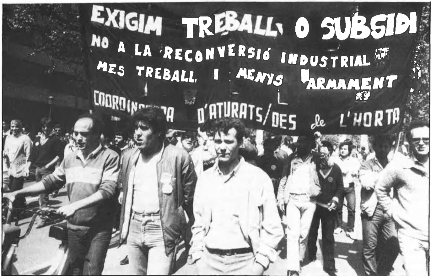
La reconversió industrial va ser la primera eina de la política econòmica socialista.

Les acusacions de Txiqui, però, no han agafat per sorpresa ningú, perquè en altres comeses, com per exemple el referèndum de l'OTAN, ja va fer servir el discurs del temor per a recuperar credibilitat. Benegas està complint al peu de la lletra una previsió de l'uge-tista Apolinar Rodríguez, quan va deixar ben clar que «la presentació del Pla d'Ocupació Juvenil comportava l'abandonament de la base social que va votar al PSOE en les últimes eleccions generals». El conflicte anava més enllà del govern i afectava també el partit i això ha impedit que el partit