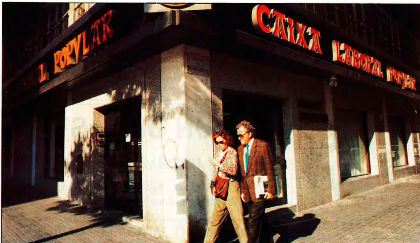
La Caixa Laboral Popular de Mondragón coordina 160 cooperatives a Euskadi.

populars entre l'opinió pública, «la consciència ecologista no ha calat massa entre la gent al nostre país, és per això que hem preferit de dir-ne banc alternatiu, que recull potser un camp més ampli».