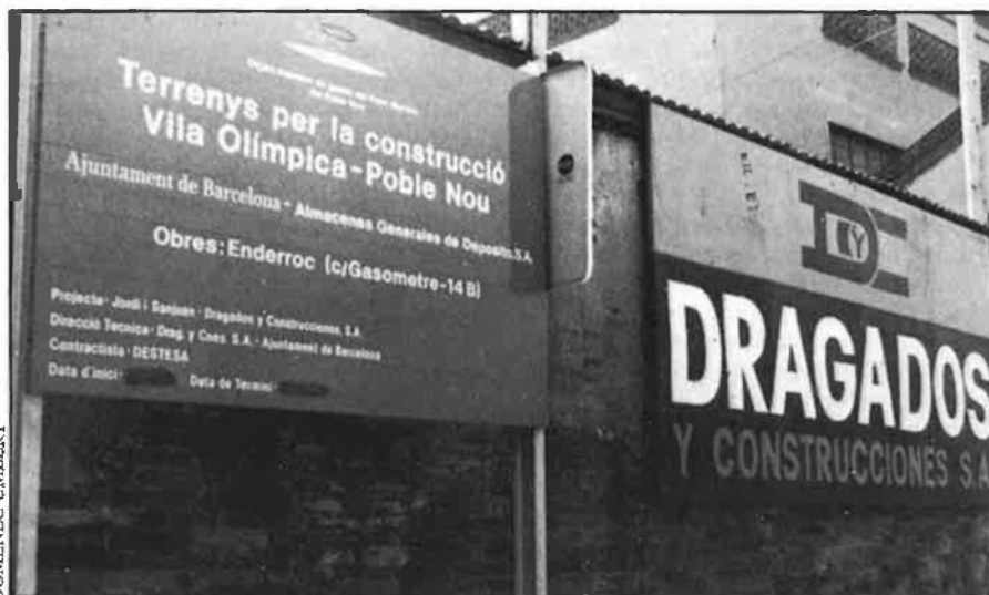
Davant una administració central amb molts diners i pocs problemes, hi ha una administració perifèrica amb molts problemes i pocs diners.

La característica essencial de la globalitat dels pressupostos per al 89 és la dotació destinada als apartats socials. Les Conselleries de Sanitat, Ensenyament, Benestar Social i Política Territorial s'enduen un 84,9% del total del pressupost, i, d'altra banda, Cultura és la Conselleria que es beneficia d'un in-