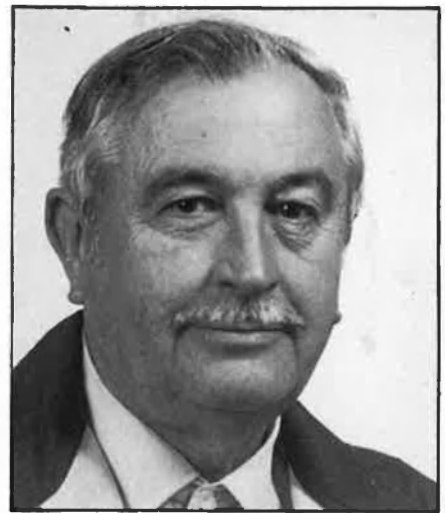
Josep Vallverdú dona nom a l'únic premi d'assaig que es convoca en solitari.