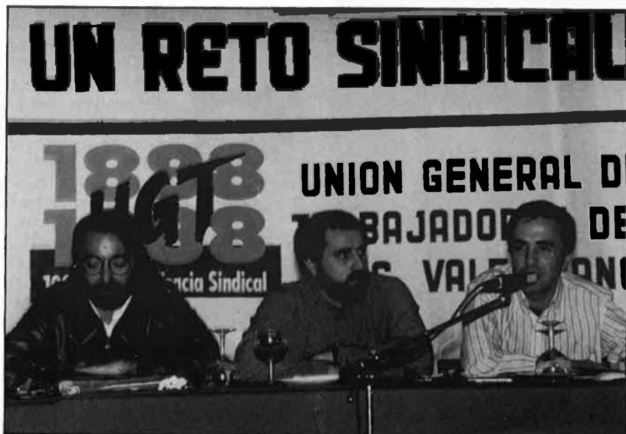
Els sindicats juguen un paper bàsic en la lluita contra l'economia oculta.

«Flexibilitzar el mercat laboral no posarà fi a l'economia submergida. Avui, l'empresa privada té totes les ajudes del món per a desgravar fiscalment. Per si fóra poc, hi ha catorze tipus diferents de contractes laborals.» □