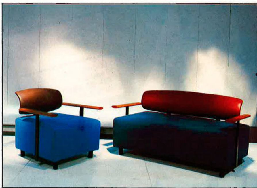
Dalt, a l'esquerra model 'Vis à Vis', disseny de Rillon Wheele, fabricat per Perobell. A la dreta, model 'Tria', disseny de coberta, Vilardell, fabricat per Gargot. Baix, model 'Soffio di Vento', disseny de G. Stopino, fabricat per Axa Internacional.

NOVES PLATAFORMES PER AL DISSENY DEL MOBLE