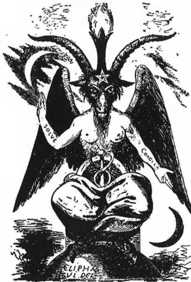
El dimoni Bafomet o boc de l'aquelarre, de la manera com el va concebre Eliphas Levi. En el front duu l'estrella que simbolitza la màgia i entre les banyes crema la torxa de la intel·ligència, de la llum màgica de l'equilibri universal. Amb les mans fa el senyal dels ocultistes, tot mostrant cap amunt la lluna blanca de Xesed i cap avall la lluna negra de Geburah.

Les sectes satàniques autèntiques busquen essencialment la implantació del