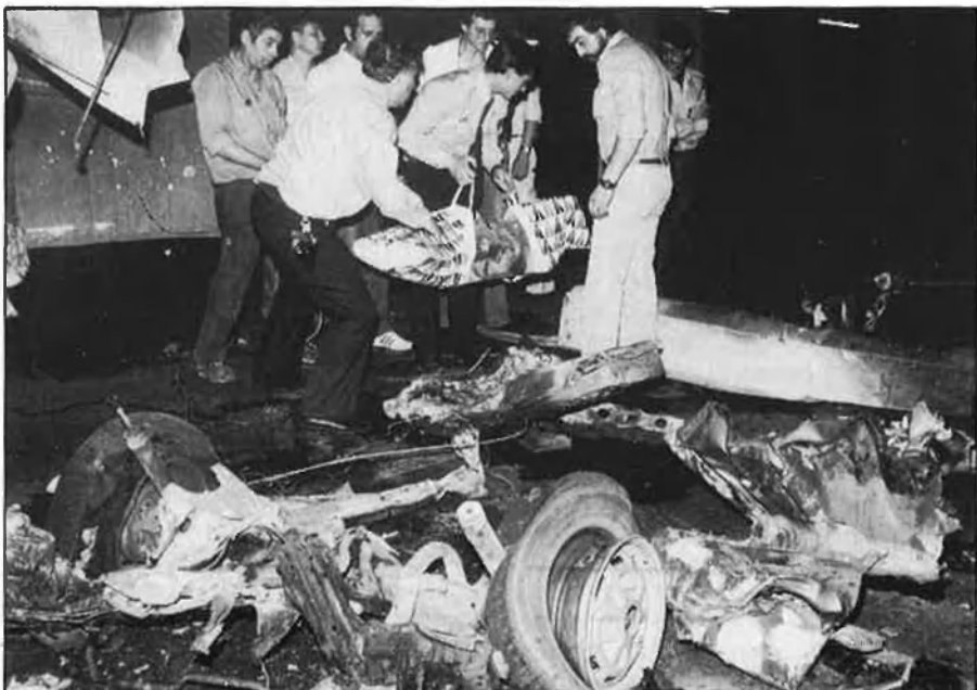
Els atemptats d'ETA puguen la moral dels seus presos.