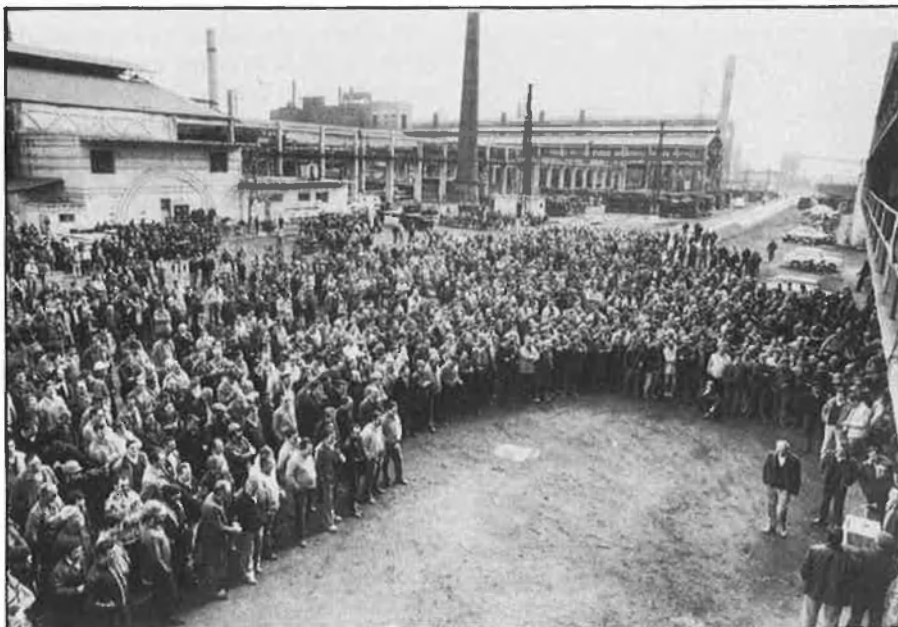
¿En-què han quedat les grans manifestacions de protesta, assemblees i reivindicacions?

Un dels trets més destacables del Port de Sagunt és la gran proliferació de botigues, bars i pubs que han obert en els darrers tres anys. Si bé és cert que després dels primers mesos de la reconversió hi va haver una immobilitat absoluta, avui dia, els estalvis de molts anys han transformat els antics treballadors d'Altos Hornos en petits empresaris.