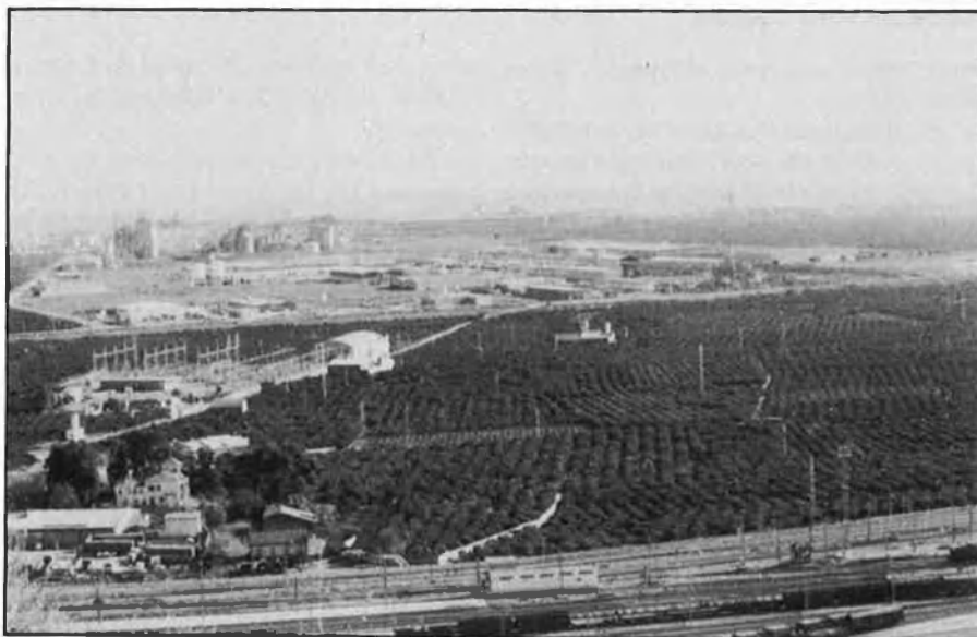
Sagunt, un important nucli diversificador del teixit productiu del país.

* Conseller d'Indústria, Comerç i Turisme de la Generalitat valenciana