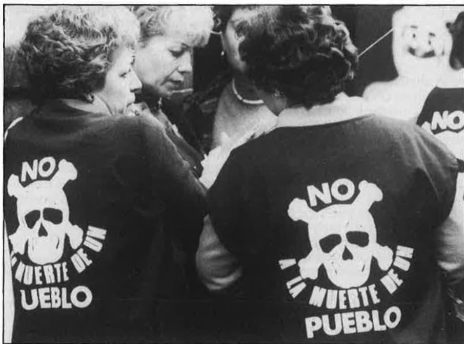
Sagunt: una experiència per a altres zones industrials d'arreu l'estat.