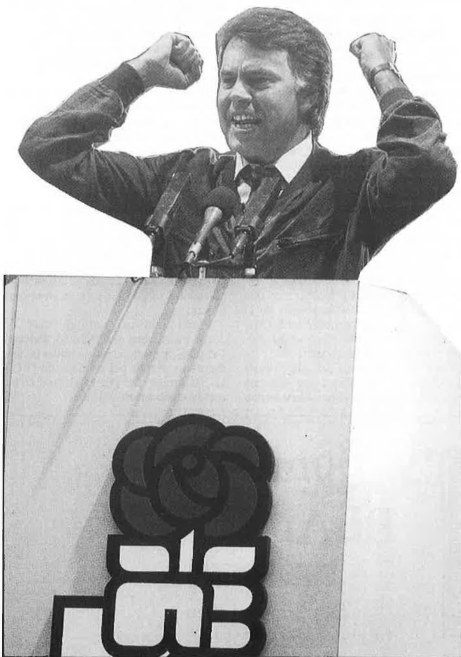
Felipe González no descarta Pujol per a formar govern, quan calga.

Aquesta orientació de la política socialista d'aliances, que Felipe González va impedir que fóra discutida en el passat congrés del partit, fou ja plantejada per alguns sectors del PSOE i, pel que sembla, tindrà influències indirectes en l'actual crisi de la dreta.