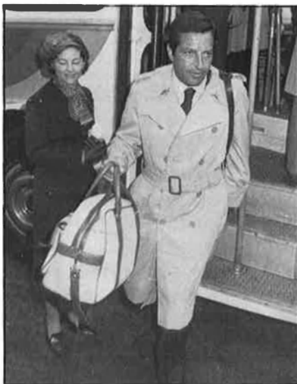
Adolfo Suárez, a l'assalt de la Moncloa.

En qualsevol cas, tot això ha portat Adolfo Suárez a plantejar-se el seu futur com a part integrant, i si és possible la més dinàmica, d'una dreta que travessa un procés creixent de descomposició. La lenta aproximació a Fraga, la instrumentalització que en el seu