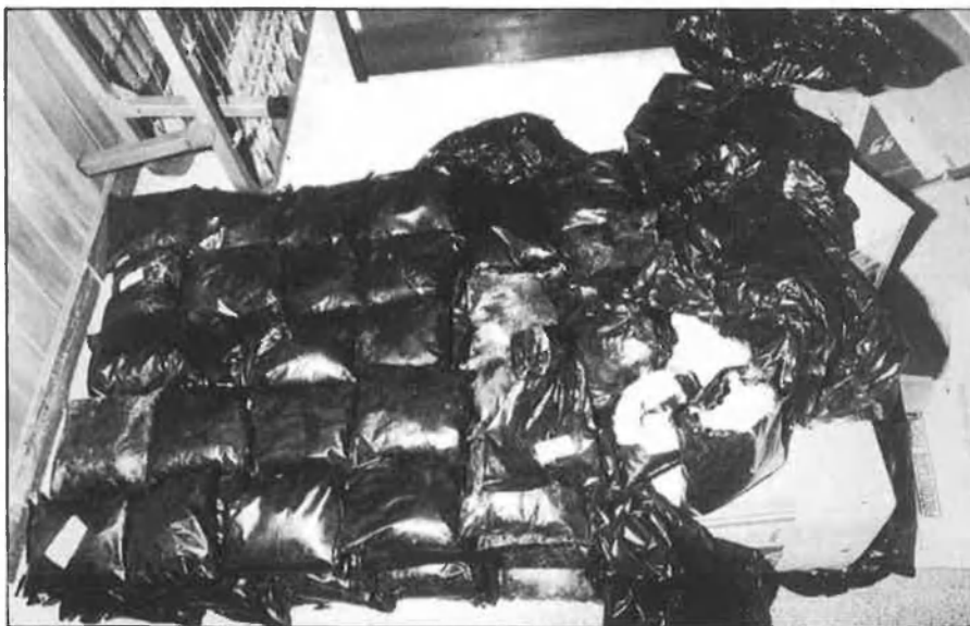
L'escamot d'ETA hauria fet un seguiment de la policia del camp del Barça.

ra actuant a Catalunya. I, més que res, si es repetiran accions de violència indiscriminada contra la població civil —la ferida d'Hipercor continua molt oberta— com l'emmagatzemament d'aquests 133 Kg. d'amonal fa suposar.