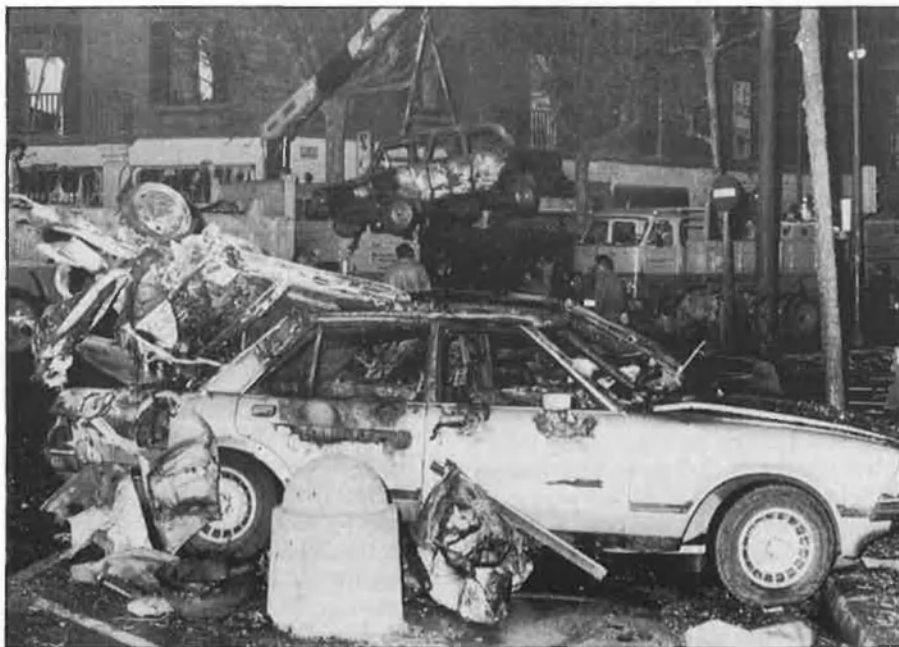
Cotxe bomba d'Eta al C/ Pau Claris, el 9 d'abril de 1987.