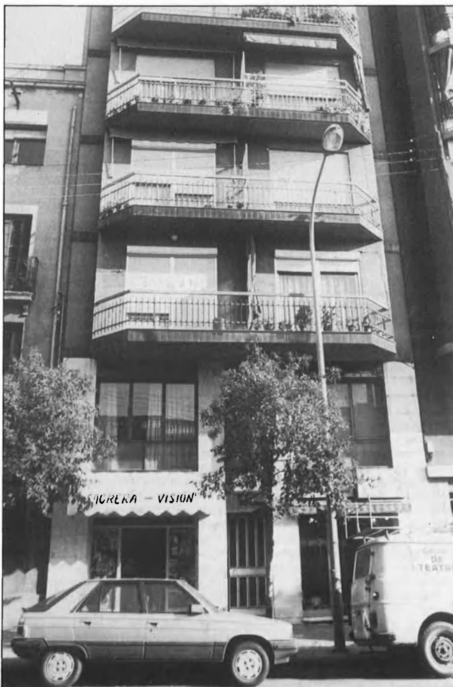
Al segon pis d'aquest edifici del carrer de la Sagrera la policia va trovar els més de 100 quilos d'amonal.