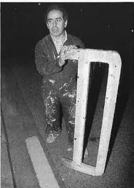
Vendre diaris i pintar l'asfalt, oficis de nit.

què els jugadors et confien la gestió dels seus diners i passen de tot».