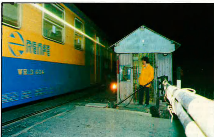
M. C., vigilat de pas a nivell.

Amb indumentària impecable, showmen de sales de festa, crupiers i porters d'això que algú ha batejat amb el nom de «clubs per a senyores de mo- ral distreta» donen un toc de distinció als seus moviments, però no es pot oblidar que, com els taxistes, els ferro-