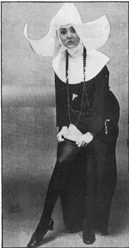
A la dècada dels 50, les mitges es convertiren en un producte de consum massiu.

moda sin costura, pero... con personalidad. Dècades després, la costura tornarà a posar-se de moda, auspiciada pel fenomen camp o retro. El fotògraf Helmut Newton farà de les mitges amb costura, objecte eròtic per excel·lència de les revistes de moda.