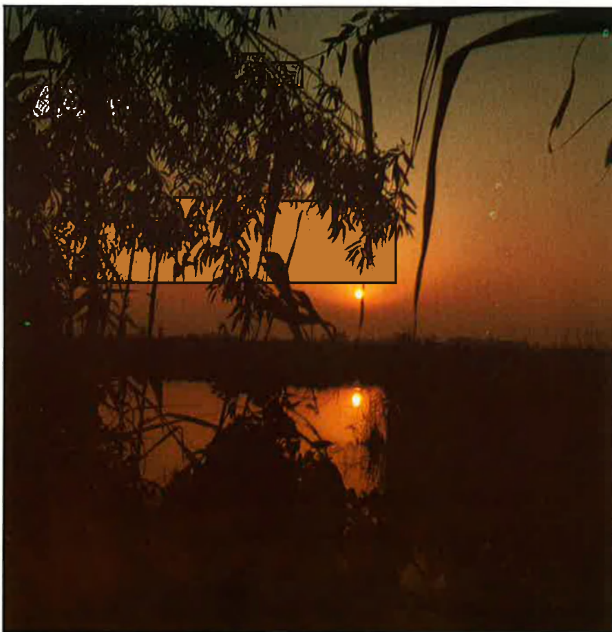
Dalt, aiguamolls del Prat de Llobregat. Baix, Pasqual Maragall, l'alcalde olímpic.

Hi ha raons objectives d'alarma. El 22,3% del territori català pateix una erosió important, segons el Departament d'Agricultura, Ramaderia i Pesca de la Generalitat. Cada any, Catalunya perd, per culpa de l'erosió, més de sis milions de tones de sòl, ja siguin agrícoles o forestals. Els incendis que ha patit la massa arbòria en els darrers 3 anys superen les 60.000 hectàrees. L'excessiva urbanització del litoral mediterrani, la repoblació a còpia d'espècies piròfites, la repoblació rural, l'agricultura química i la pol·lució galopant de les conques fluvials han agreujat la situació. El testimoni més clar d'aquesta realitat és el diagnòstic