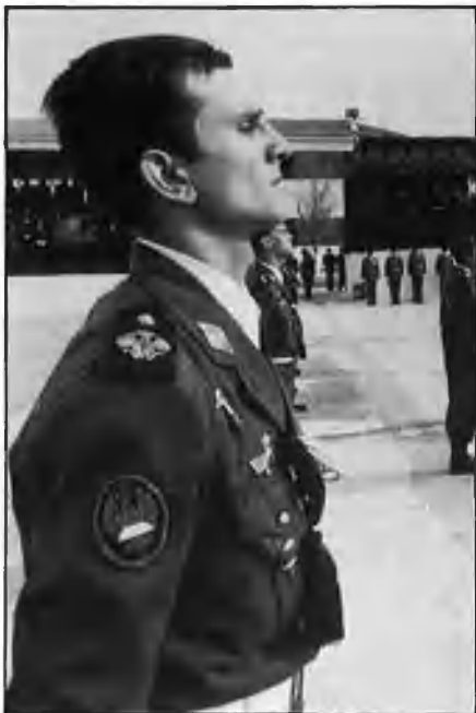
El MOC no accepta la PSS.

dibles per al funcionament d'una institució».