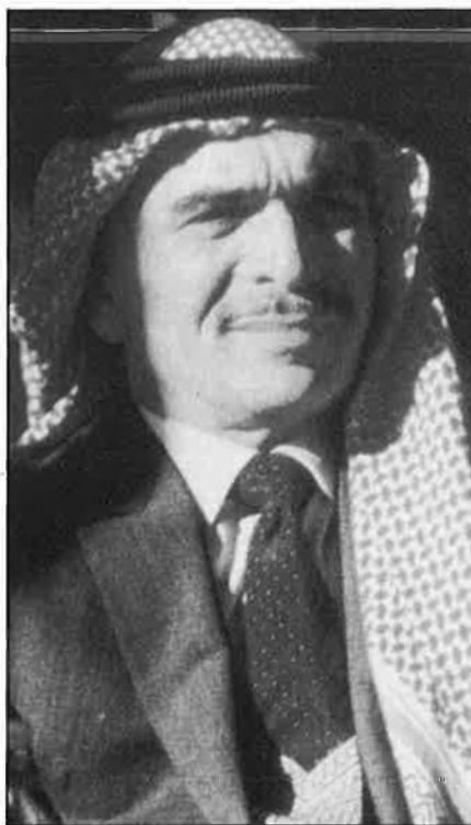
Dalt Shimon Peres; baix, Hussein de Jordània.

»Per a mi, l'opció jordano-palestina no és només un invent, sinó una realitat. Ara bé, l'OAP ha de deixar constància de la seua voluntat per fer-se càrrec d'aquest problema, de la seua capacitat per a assumir aquesta responsabilitat. Ara per ara, la població de Cisjordània i Gaza està dividida. Per això, crec que l'alternativa que considerarem fa any i mig constitueix l'única solució viable.