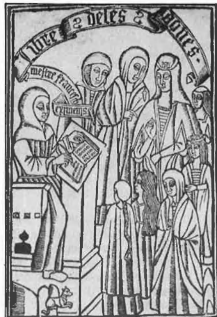
Al «Llibre de les dones», de Jaume Roig, li van ser afegits nous versos pels censors, favorables a la dona entre les dones, Maria.

Sembla que l'autora fos l'hereva de les discussions que predominaren —més del que ens ha estat explicat— entre els cristians dels primers segles. El paper exercit per Maria Magdalena, l'evangeli gnòstic de la qual ens ha deixat bones proves de la fricció entre l'element masculí i el femení en aque-