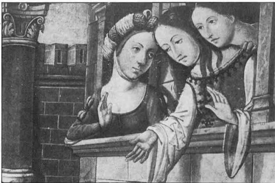
Sor Isabel de Villena volia posar les coses al seu lloc: igualtat de la condició femenina.

Amb tot això podem demanar-nos què hi fa la polèmica, que endevinem, en una obra medieval i mongívola, dedicada a la vida de Crist. I és que, com la seva lectura aviat posa en relleu, al costat de moltes consideracions, com ara la gran cultura demostrada per l'autora, el seu tarannà clarament aristocràtic i senyorial, la seva gran intel·ligència de dona va dedicada al paper