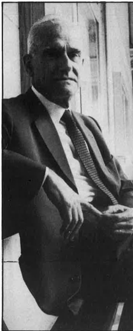
«A mi no em fa por una colla que defensen el valencià en castellà».

—Tècnicament no hi ha perill. Ara bé, existeix una Acadèmia de Cultura Valenciana que fa una ortografia pròpia, precisament en contra de les Normes Ortogràfiques de Fabra, que deixa els accents a l'arbitri de l'usuari. És una cosa que no té ni cap ni peus