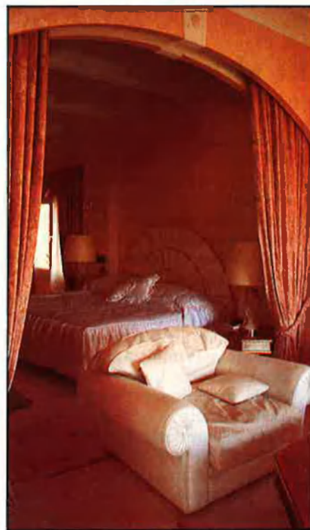
Villa Italia, un espai concebut amb el mateix luxe dels hotels europeus. Mostra interior d'algunes habitacions.