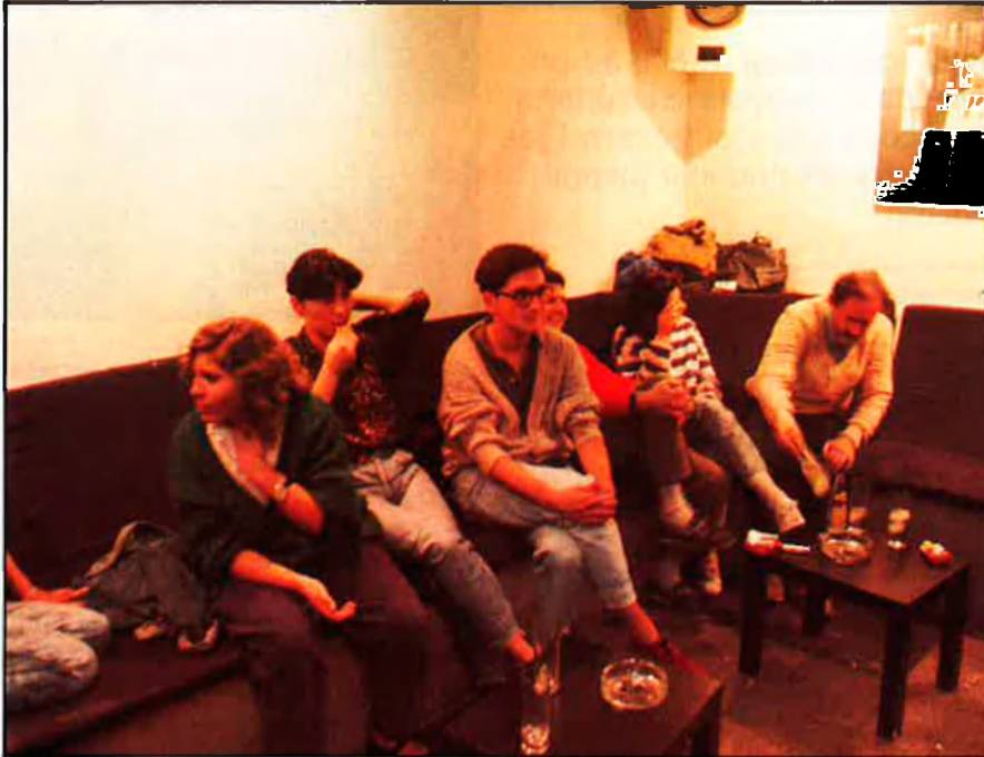
El pla d'ocupació juvenil: ¿tornar a la figura de l'aprenent?

Va adreçat sobretot a joves amb poca qualificació laboral, i vol complementar el sistema actual de formació i de pràctiques. Els contractes hauran de ser per un mínim de 6 mesos i un màxim de 18, que es podran allargar fins als tres anys per mitjà d'altres contractes temporals ja existents. Es diferencia del pla preparat pel PSOE en algunes qüestions menors, com és la supressió de les subvencions econòmiques als empresaris que creïn noves places de treball. Per alguns és tornar a la figura de l'aprenent. □