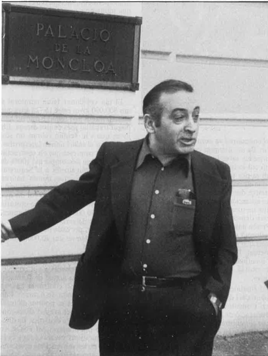
Nicolás Redondo està ara molt lluny de les línies econòmiques que marca la Moncloa. Dalt, Antonio Gutiérrez.

S i bé fa dos anys que la societat espanyola viu sense un pacte social que estabilitzi les seves relacions laborals, encara hi havia unes remotes perspectives d'aconseguir acords en alguna parcel·la bàsica, i bona prova d'això és que els interlocutors socials s'han presentat a totes les meses negociadores. Ara ja tothom creu que és inútil tornar a intentar pactes globals entre tots els protagonistes de la vida laboral.