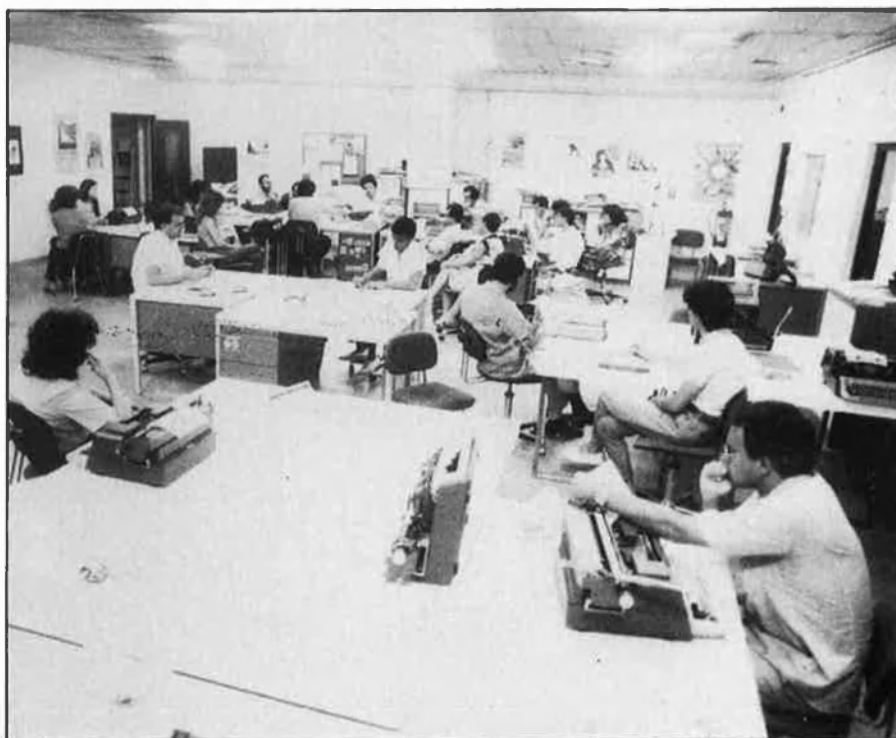
Redacció del desaparegut «Diario de Valencia».