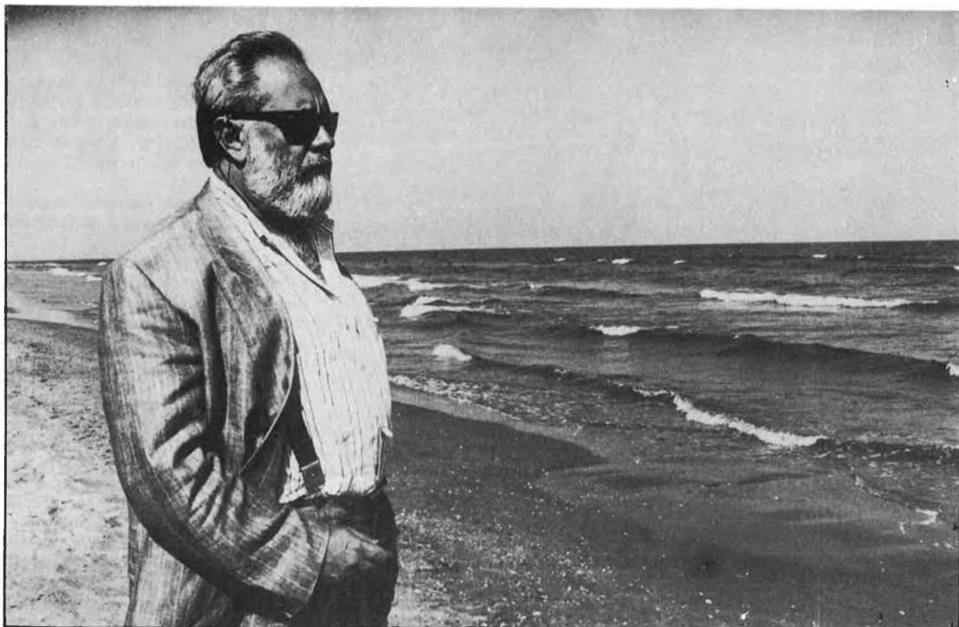
Byron va tenir experiències homosexuals i provocava l'escàndol entre els mediocres.

cosa que feien era fumar una mica de quif i beure un poc de làudanum. De tota manera no se'n passaven. Byron no va beure alcohol en tota la seua vida ni tampoc Shelley. Només a Venècia es va lliurar amb una certa intensitat als plaers de la beguda, el sexe i el menjar. Però va decidir controlar-se per no engreixar. Cuidava molt el seu físic.