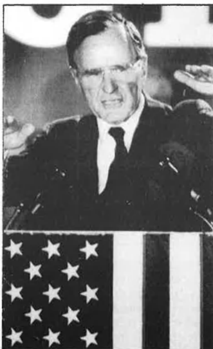
Dukakis (dalt) arrasa. Baix, Bush.