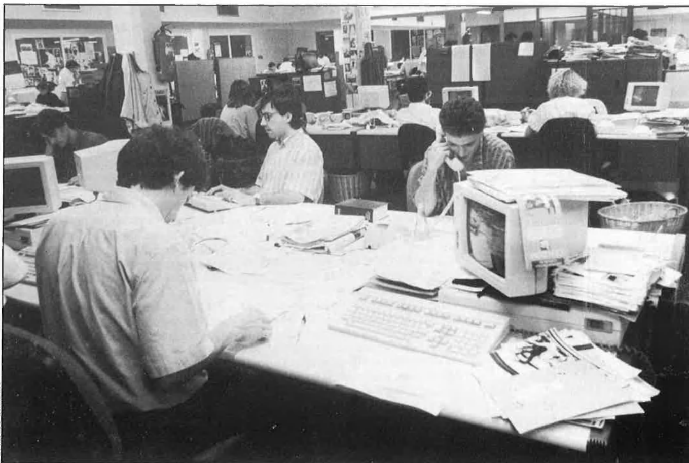
Redacció del «Diari de Barcelona».

Tanmateix, durant aquests mesos d'octubre i novembre, EL TEMPS serà l'únic setmanari en català als quioscos. I és que El Món s'enfronta ara a