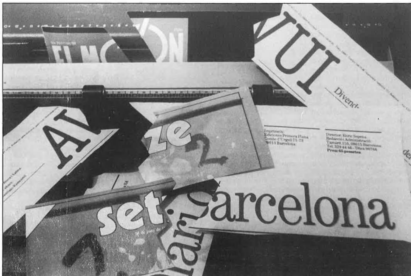
Premsa en català: un panorama convuls.

«l'empresa ha fet els seus estudis de mercat, i ha decidit tancar el suplement. Qualsevol revista d'informació general necessita que la publicitat compense les despeses. I jo crec que amb una empresa que hagués tingut prou de paciència, això podia haver funcionat, encara que, ja dic, molt a la llarga». Els escassos ingressos publicitaris han estat l'argument utilitzat per la nova direcció de Cambio 16 per a justificar el tancament. ¿Significa això que el Grupo 16 renuncia a una major presència en el mercat català? En absolut, entre els plans de la revista figura com a objectiu augmentar la presència del setmanari a Catalunya. Però, això sí, sempre en castellà.