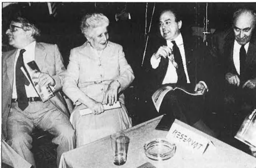
Festa de celebració del número 100 d'EL TEMPS.

A la seu del Grupo 16, a Madrid, han fet números. I no han oblidat que tots els estudis de mercat assenyalen que Catalunya representa, per als setmanaris espanyols d'informació general, entre un 20% i un 30% de les seves vendes. Molt per damunt de la proporció que representa la població catalana en relació a la resta de l'estat. Es tracta, a més, d'un públic molt agraït: la dedicació d'aquests setmanaris a la informació catalana és sempre marginal. Tant fa, Catalunya segueix sent un bocí gens menyspreable per a unes empreses que veuen com els suplementos dominicals dels diaris esgarrapen a una velocitat rapidíssima el mercat tradicional dels setmanaris.