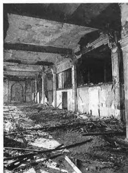
Un incendi ha acabat amb els banys.