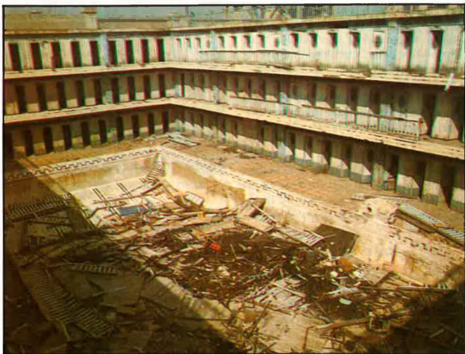
BANYS DE SANT SEBASTIÀ