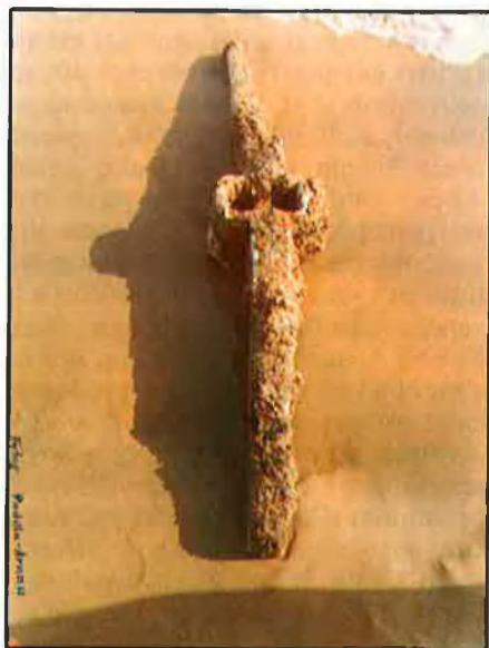
Cep roma procedent d'una prospecció realitzada en aigües de la costa de València.