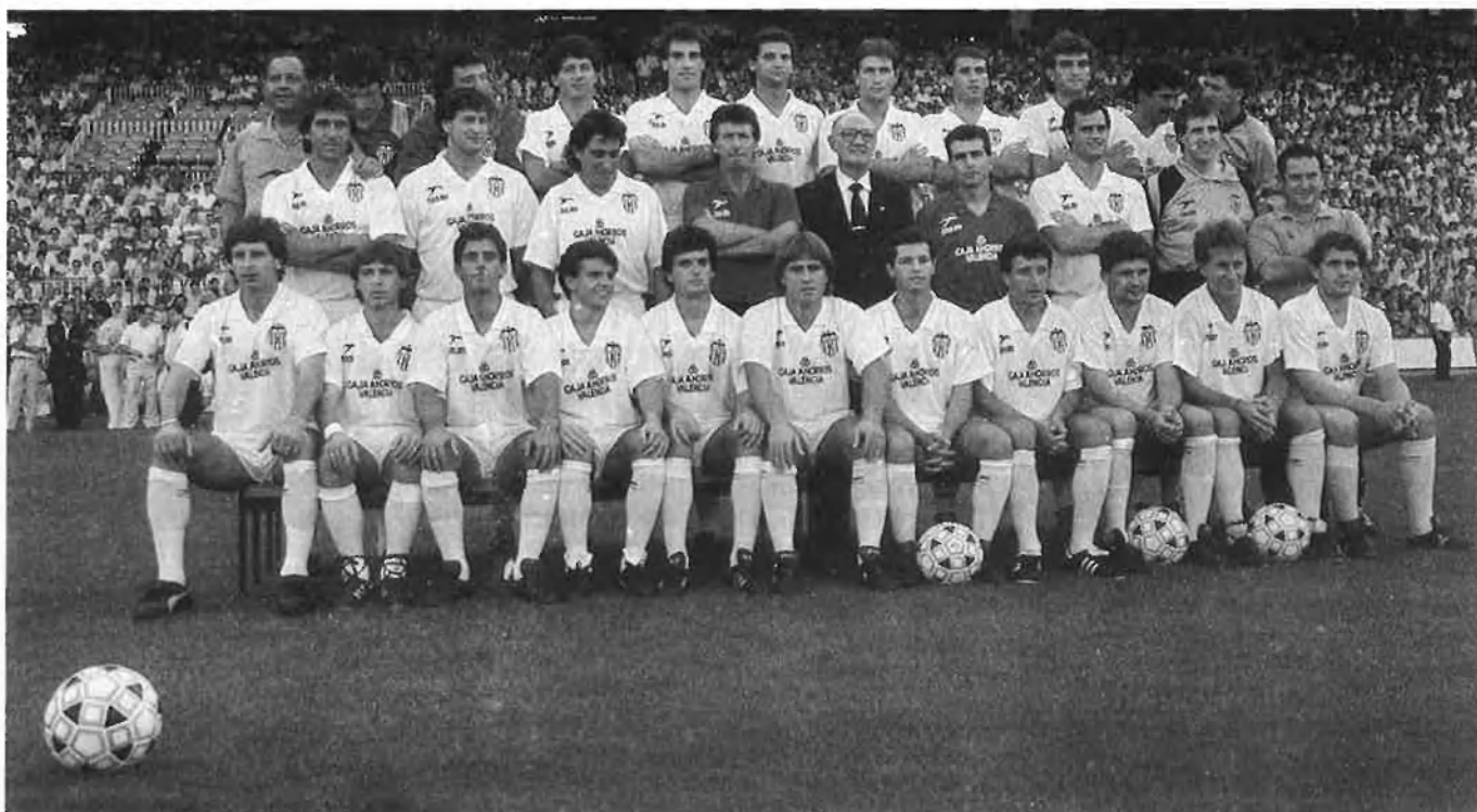
Els espònsors es disputen el patrocini dels esports de masses i és estrany l'equip de futbol, de bàsquet o del món del motor que no en tinga.