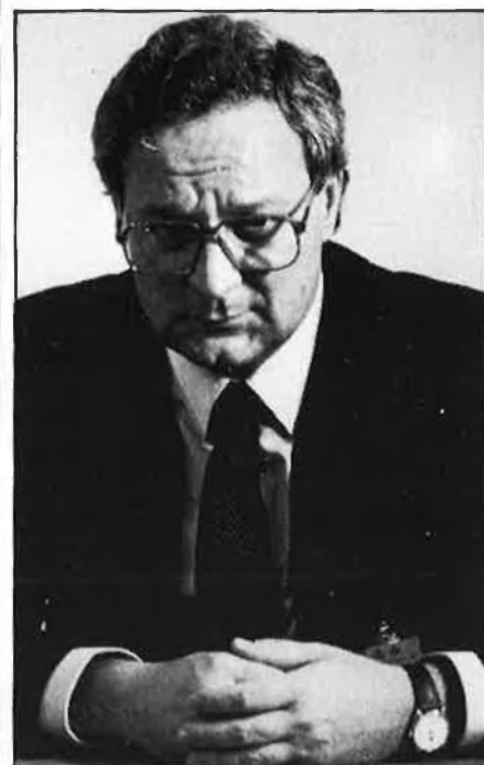
L'alcalde de València, estressat per la situació del seu grup polític a l'Ajuntament.

doctor Robert Sapolsky, de la Universitat de Stanford, estar en un nivell més alt és menys aclaparador que estar en un nivell més baix. Únicament — explica Sapolsky — una jerarquia inestable de superiors tenen més problemes que els seus subordinats.