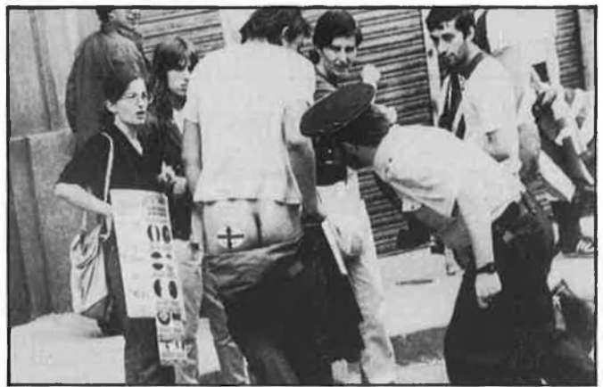
Oficial de policia, una de les professions que produeixen més «stress».

En aquests casos —diu— el millor és reaccionar a la inversa. És a dir, quan tingues un problema a casa, deixa-l'hi i quan arribes a la feina, el puntelló li'l dones al teu superior».