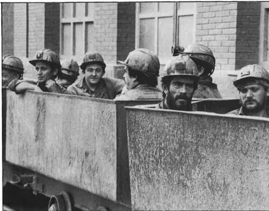
La de policia, miner (a la foto), àrbitres i agricultors són algunes de les professions més estressants.

parlar, li va explicar al seu metge que se sentia com una dona fracassada.