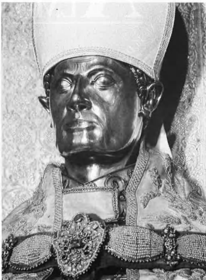
Els objectes d'art religiosos tenen una presència destacada en aquesta fira.