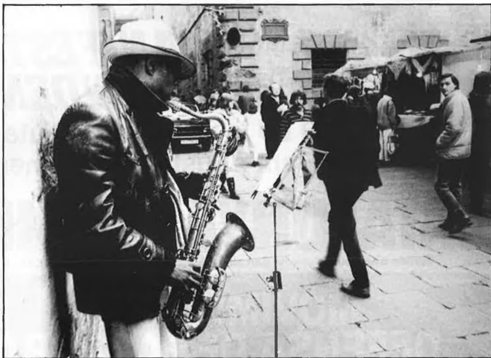
«Un negre amb un saxo», de Bellmunt, a la Mostra.

Els que ja van disfrutar amb Yesterday , premiada amb la Concha d'Or a Sant Sebastià, podran divertir-se de