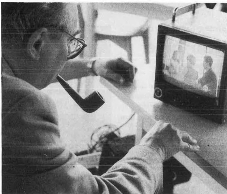
Mercafilm se celebrarà paral·lelament a la Mostra.

nou amb Tren para Hollywood , del realitzador polonès Radoslaw Piwo-warki, que ha sigut membre del jurat en la recent edició del festival de Do-nostia.