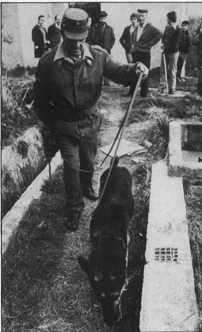
La pista que ha seguit la Guàrdia Civil ha donat uns resultats ben pobres.