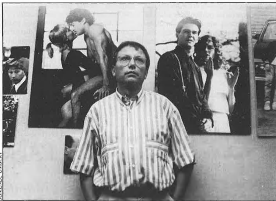
«La crisi en si del cinema no existeix, la creem tots nosaltres».

—La teva primera empresa va ser la distribuïdora Lauren. Després vas passar a tenir cinemes. En tens sis a Ma-