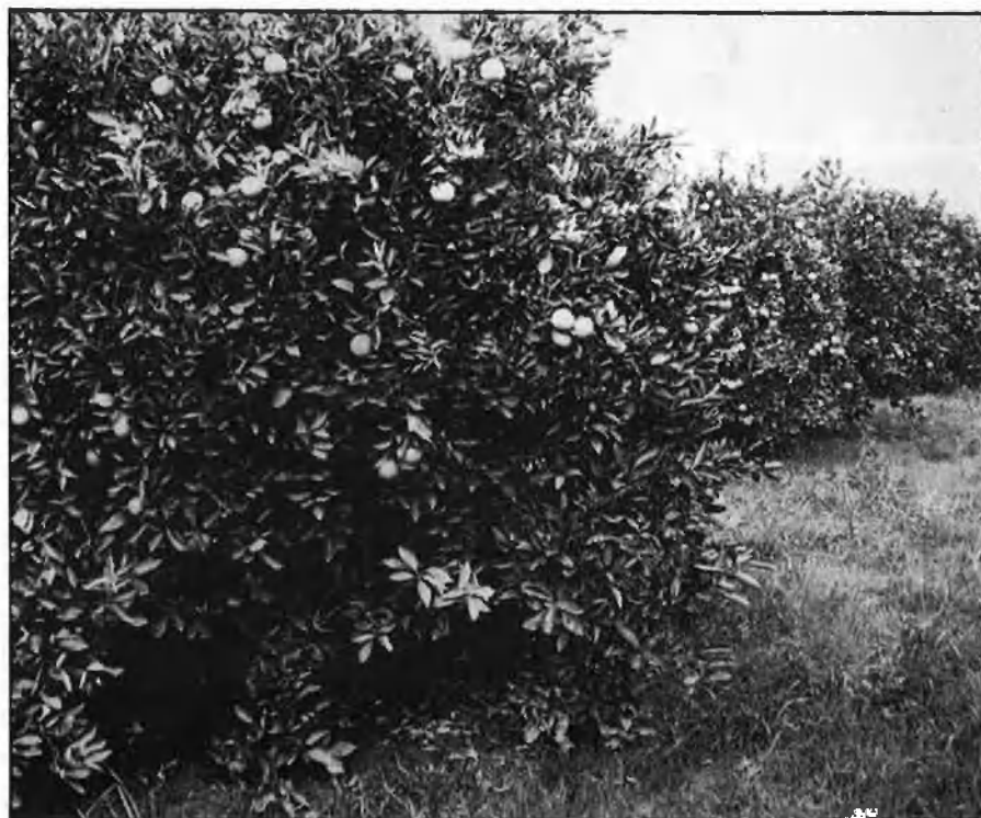
Les taronges s'estan pagant a millors preus que en la temporada anterior.

Els camions valencians arriben a Europa en un moment que encara no està clar de quina forma es decidiran els contingents que cadascú té dret a exportar. Un bon moment en el camp perquè la disminució de collita actuarà com a factor positiu en l'oferta i demanda i les taronges estan pagant-se a preus molt més interessants que la catastròfica temporada passada. Malgrat tot, la situació no està gens clara i encara es produiran esdeveniments polèmics. I tot això sense parlar del passeig de taronges del Marroc que s'inicia pel novembre. □